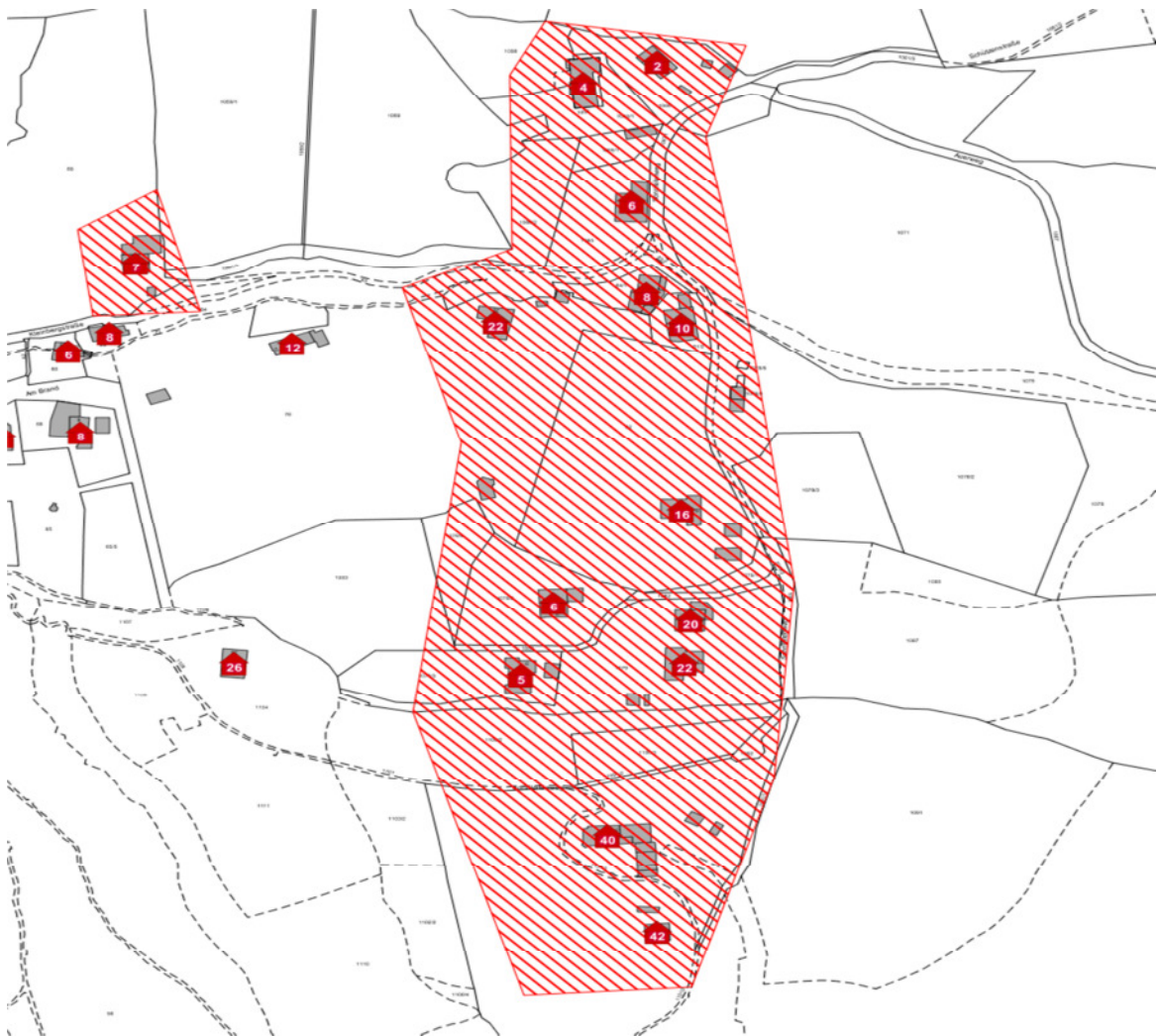
Karte 2: Bereich Sonnleitenweg, Kleinbergstrasse, Bräuweg

Nach dem Auf- bzw. Ausbau sollen in diesem Bereich Übertragungsraten in mindestens doppeltem Umfang 1 der Übertragungsraten (Upload und Download) gemäß der Darstellung des Ergebnisses der Markterkundung für alle möglichen Endkunden, die noch nicht mit Bandbreiten nach Nr. 1.2 Satz 3 BbR versorgt werden und Übertragungsraten von mindestens 100 Mbit/s im Download und von mindestens 10 Mbit/s im Upload für alle möglichen Endkunden sowie Upload-Geschwindigkeiten, die viel höher sind als bei Netzen der Breitbandgrundversorgung (mindestens 2 Mbit/s) zu Verfügung stehen.